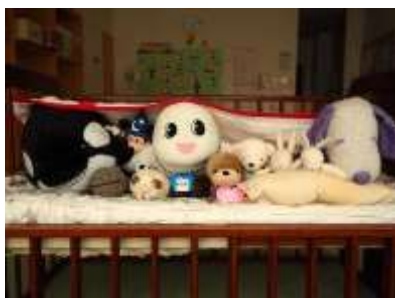
東藻琴図書館（8月4日）