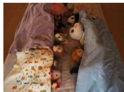
女満別図書館（8月5日）