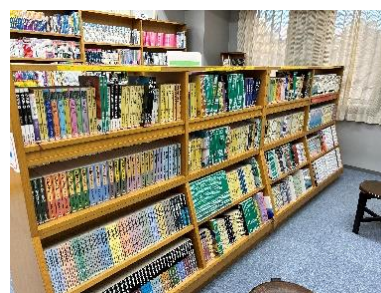
大活字本コーナー