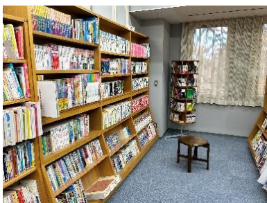
コミックコーナー