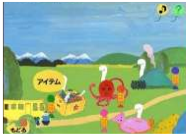
ジャンルを選びましょう