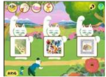
おすすめの本を表示