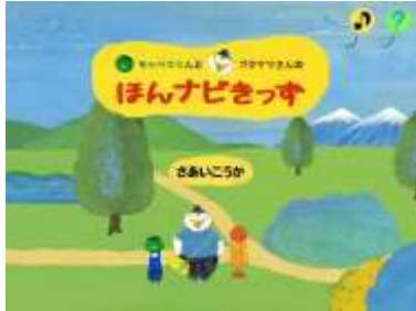
ほん探しの旅スタート

図書館にある利用者端末で、「ほんナビきっず」というサイトが利用できます。長新太さんの絵本に出てくる、キャベツくんとブタヤマさんと一緒に本探しの旅に出かけましょう。選んだテーマに沿った絵本や児童書を3冊紹介してくれるよ。「読書の記録帳」の記帳や、本の検索にも使う端末なので、仲良くゆずり合って使ってね。