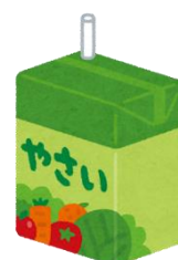
紙パック (ストローつき)