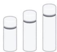
水筒・マイボトル